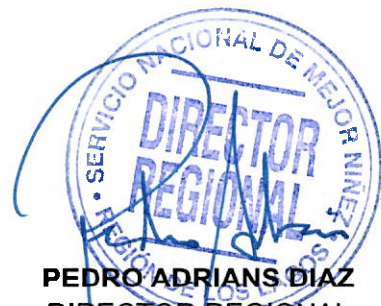
PEDRO ADRIANS DIAZ DIRECTOR REGIONAL SERVICIO NACIONAL DE PROTECCION ESPECIALIZADA A LA INFANCIA Y ADOLESCENCIA REGIÓN DE LOS LAGOS